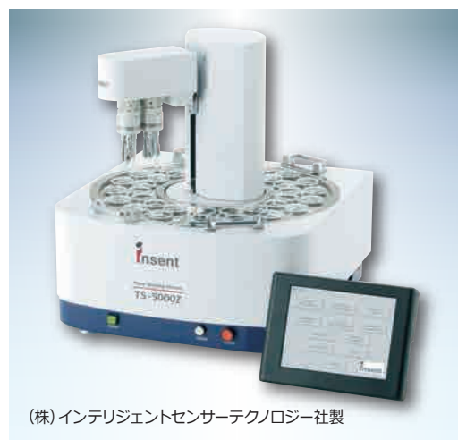
(株)インテリジェントセンサーテクノロジー社製